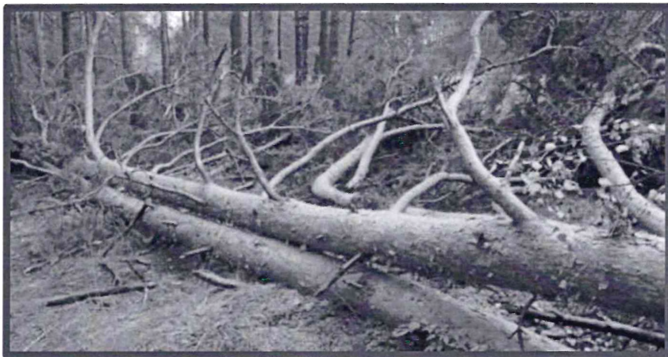
Изображение № 5 Лежащее на поверхности земли ветровальное дерево, не имеющее признаков отмирания. Не является валежником

Ветровальные деревья (вывернутые с корневищем) не являются мертвыми деревьями, хотя они лежат на земле, но могут продолжать жить, расти и даже давать потомство (вегетативное).