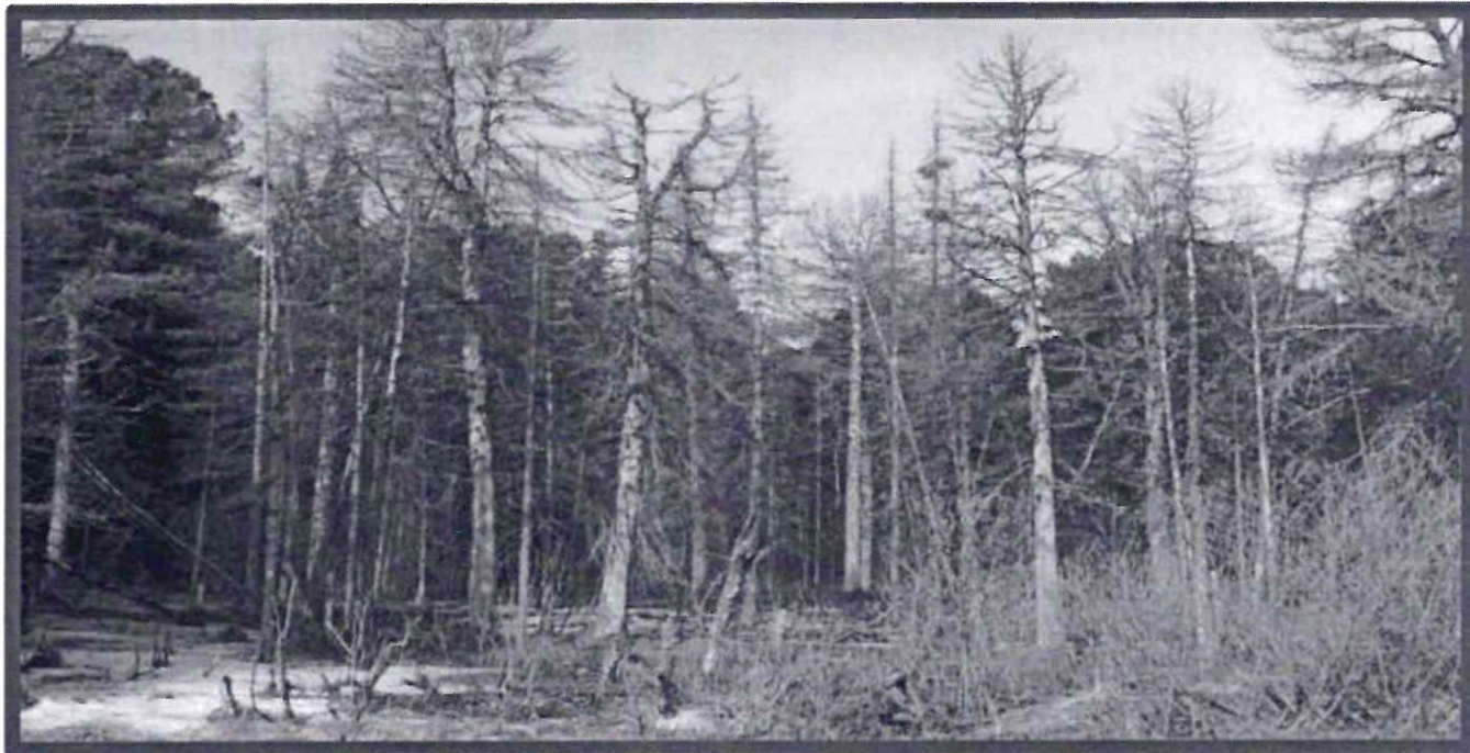
Изображение № 4 Сухостойное дерево. Не является валежником

Кроме того, необходимо обратить внимание, что деревья, которые лежат на земле, но не имеют признаков естественного отмирания (имеют зеленую листву или хвою), определять как «мертвые» не допускается (смотри изображение № 5).