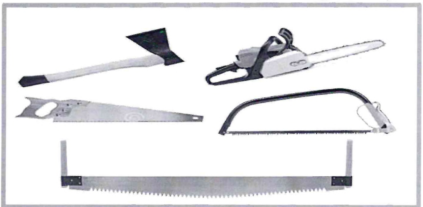
Изображение № 8 Разрешенные инструменты для заготовки

При заготовке валежника допускается применение ручного инструмента (ручных пил, топоров, бензопил) (смотри изображение 8).