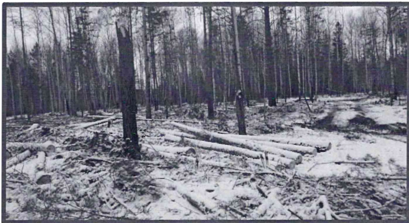
Изображение № 7 Брошенная древесина вдоль лесовозных дорог. Не является валежником